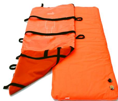
Saltea și husă

Saltea vacuum VAKUFORM® fără husă detașabilă (e.g. from VM-171/1 to VM-194/1)