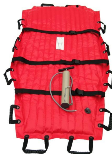
VM-171/1 and VM-110