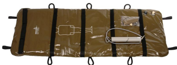
VM-203/2 și pompă VM-210

Saltea vacuum+compresie VAKUFORM® cu husă protecție exterioară detașabilă (ex. VM-203/2)